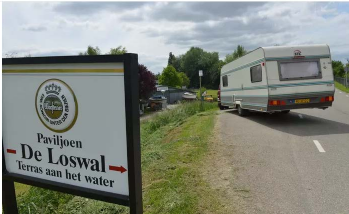
▲ Camping de Loswal