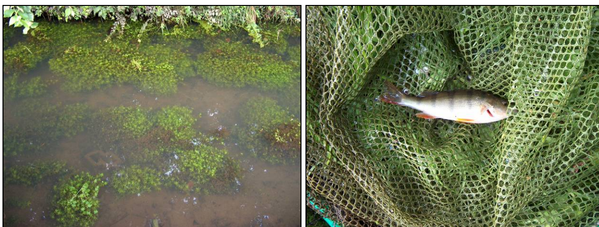
Figuur 2. Beeld van het water op camping 't Kalverland en een gevangen brasem.

Tiendoornige stekelbaars en brasem zijn niet beschermd onder de Flora- en faunawet en niet bedreigd volgens de Rode lijst.