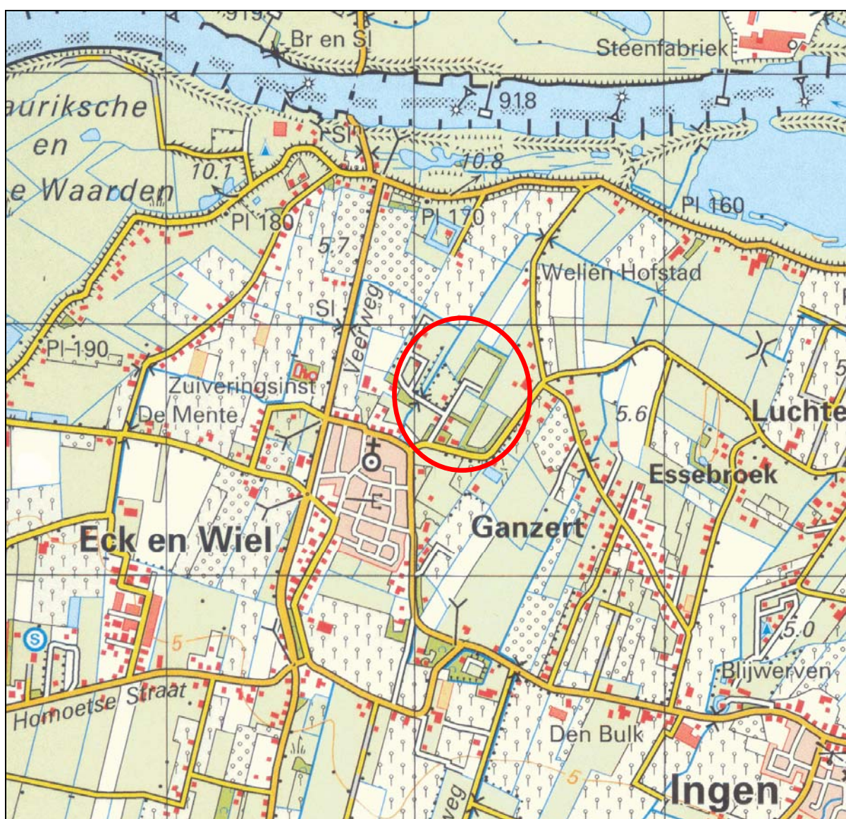
Figuur 1. Globale ligging van camping 't Kalverland te Eck en Wiel.

Er bestaat het voornemen om camping 't Kalverland te Eck en Wiel te reconstrueren. Deze verandering kan negatief zijn voor beschermde planten- en diersoorten. Op basis van beschikbare bronnen is ingeschat dat beschermde vleermuizen en vissen voor kunnen komen op de camping. Op grond hiervan heeft RBOI te Rotterdam, die het bestemmingsplan opstelt, aan Adviesbureau Mertens te Wageningen verzocht om deze beschermde natuurwaarden in beeld te brengen. Voor RBOI is het dan mogelijk om met de beschermde natuurwaarden rekening te houden. In onderhavig rapport wordt verslag gedaan van een veldinventarisatie naar deze soortgroepen.