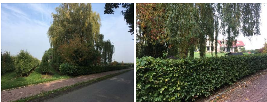
Zicht vanaf de Uiterdijk: de volwassen solitaire wilg (links) en de geschoren haag op de perceelsgrens aan de straatzijde.

Het huidige bedrijfsperceel met de bedrijfswoning aan de Uiterdijk en de bedrijfsbebouwing op het achtererf is reeds voorzien van de nodige landschappelijke beplanting op de perceelsranden aan de west- en zuidzijde. Aan de zuidzijde, de straatzijde, staat reeds een lage geschoren haag en enkele solitaire bomen, waarbij op de hoek een beeldbepalende volwassen wilg staat. Naast de wilg staan enkele jonge bomen die voldoende ruimte hebben om volledig tot wasdom te komen. Aan de westzijde staat op de perceelsgrens reeds een groensingel bestaande uit diverse soorten struweel en boomvormers. Ten westen van de huidige bedrijfsloodsen staan enkele volwassen bomen. Onderstaande foto's illustreren de huidige situatie van de planlocatie.