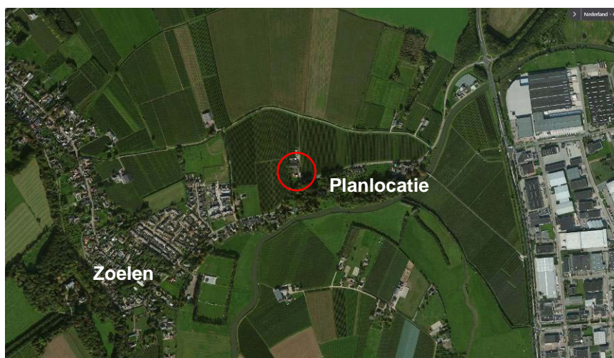
Ligging plangebied

De planlocatie ligt aan de Uiterdijk te Zoelen, in het buitengebied van gemeente Buren. De Uiterdijk loopt van de dorpskern van Zoelen naar de provinciale weg N835 in het oosten. Onderstaande luchtfoto illustreert de ligging.