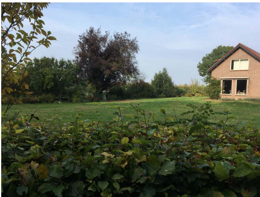
Voorzijde van de planlocatie: de bedrijfswoning en de groensingel van verschillende soorten struweel aan de westzijde.